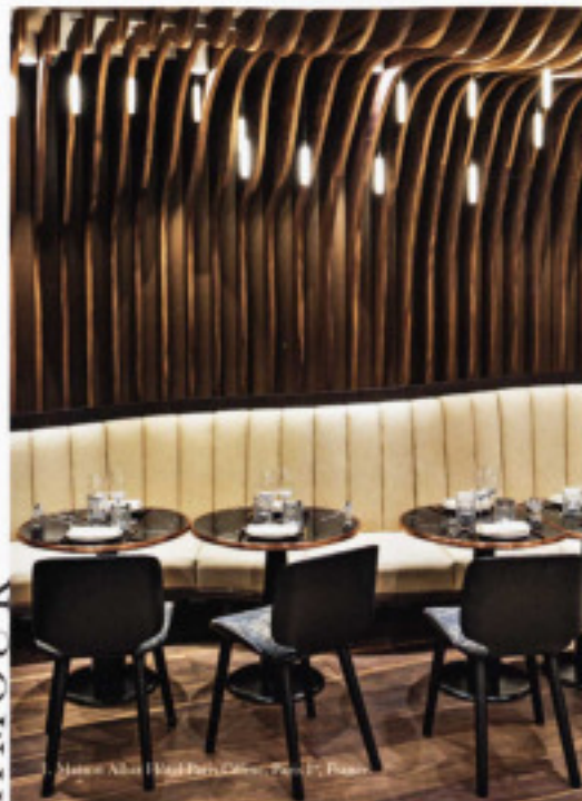
Maison Albar Hôtel Paris Céline, Paris 1 er , France