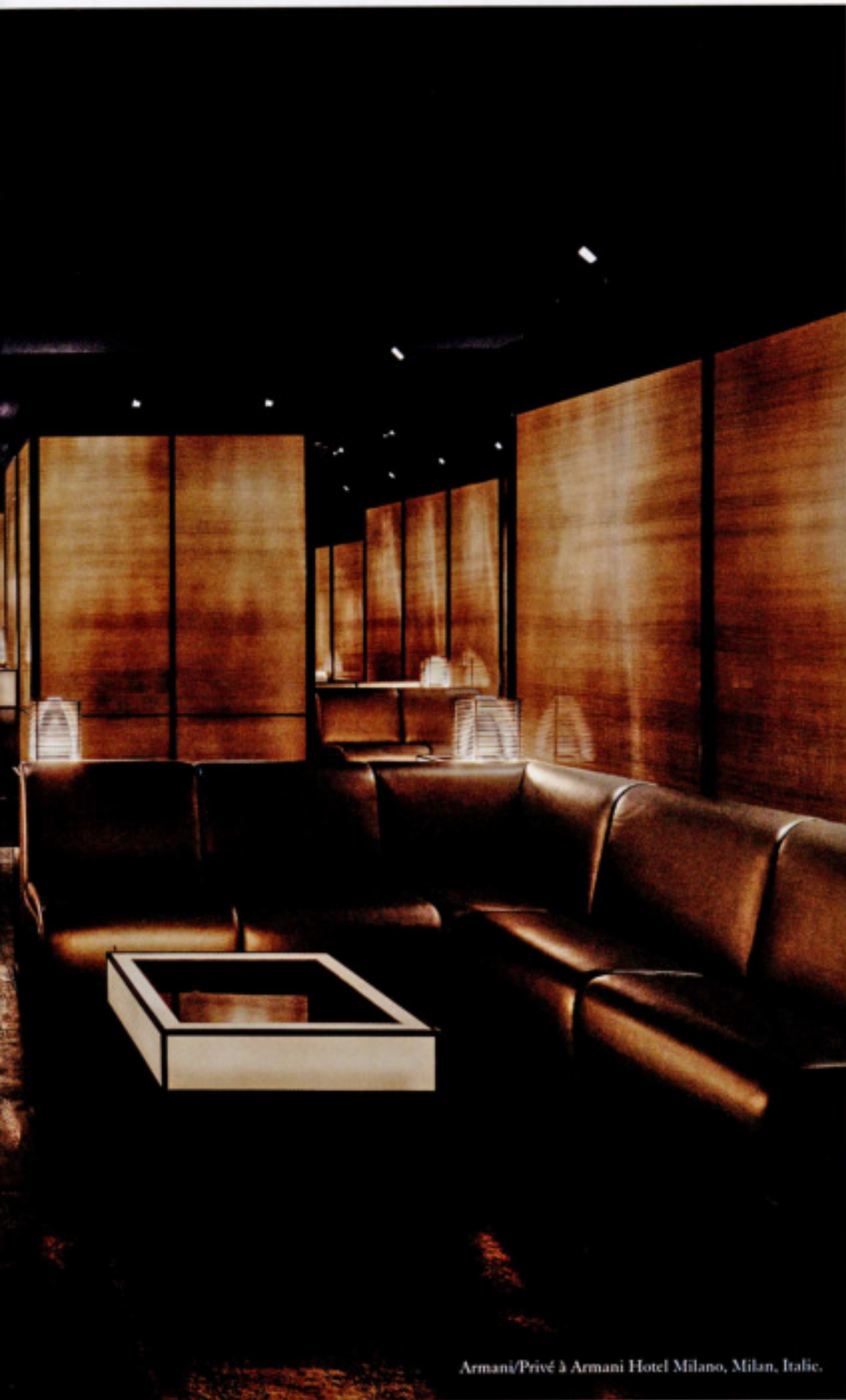
Armani/Privé à Armani Hotel Milano, Milan, Italie.

Et si, à l'hôtel, l'idée était d'aller dormir le plus tard possible? Boîtes smart pour nuits chic.