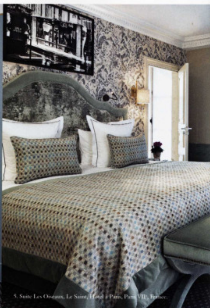
5. Suite Les Oiseaux, Le Saint, Hôtel J Paris, Paris VII, France.

<< Nouveauté: un Coin Gourmand vend des pâtisseries maison sans gluten "à emporter", estampillées Les Bains.