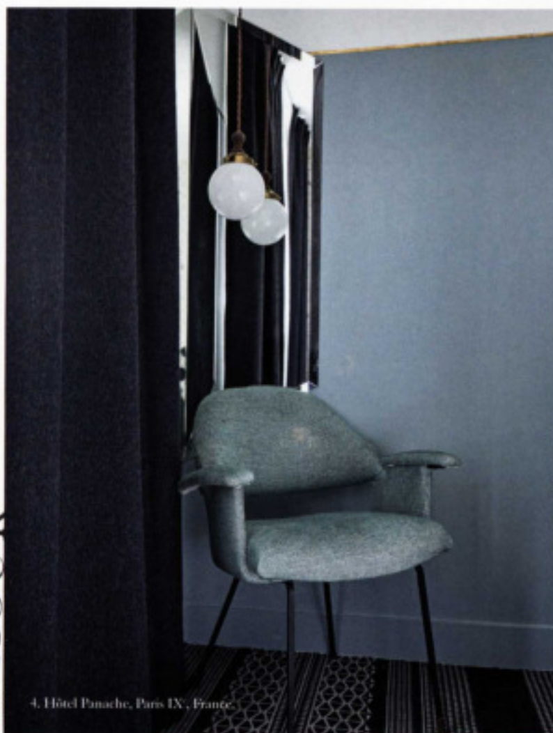
4. Hôtel Panache, Paris IX, France.